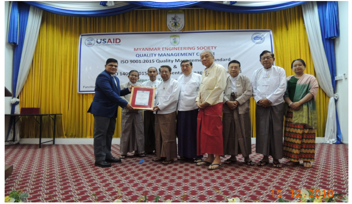
'Di bmv(15)&ufeU MES Function Hall WCF Opening Ceremony of QMC Training & Ceremony of ISO 9001:2015 Certificate Conferring to MES” jyk kōm ōuō ōat miji fī ESA [ kumfwōi fī; wuā&muōm ōuō r Stzōr ōum; aijm ōm; t; D ISO Certificate t; vūō& t pōf