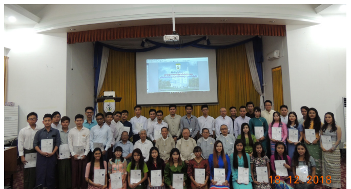
'ဒီပဲမ်(17) & ယူနီဗက်စတီ Function Hall WGC MES i vsi ဒါပဲမ် WGC ဟု ဟု ဟု