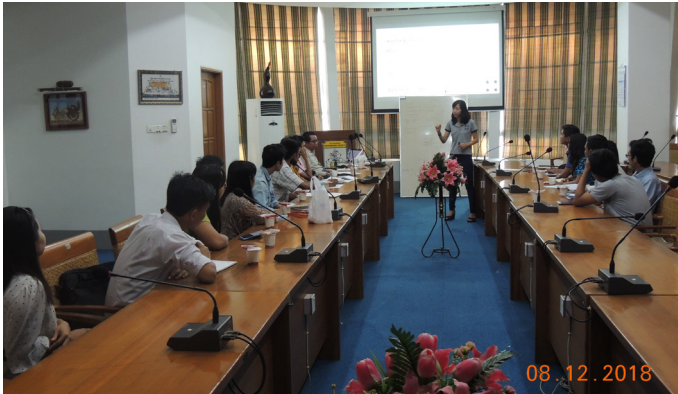
'Di ၆၈(8) & ufe U MES Conference Room WCF "Seminar on Youth & Career" jyk k p o f

'Di ၆၈(7) & ufe U Dulwich College Yangon WCFusi fyykkaom & eukfwpzka; uk P D D u f (New Yangon Development Company Ltd - YCDC) \ & eukfwpzka of Master Plan yxrtqi ft vjka q a E G W P O Di firmi ax;? CEC O Di firmi firmi ESPEC O p e f u l w u f & m u c h o n f