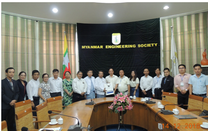
'ဒီပဲခူး(၁)အဖွဲ့' U MES Function Hall W/G 'ဒီပဲခူး(၃)အဖွဲ့' U MES Conference Room W/G Meeting တပည့်အဖွဲ့ဝင်များနှင့် ပူးတွဲအဖွဲ့ဝင်များအကြား ပူးတွဲအဖွဲ့ဝင်များ၏ မြန်မာ့အသံ့အသွယ်အဖွဲ့ဝင်များ၏ တပည့်အဖွဲ့ဝင်များ၏ မြန်မာ့အသံ့အသွယ်အဖွဲ့ဝင်များ၏ မြန်မာ့အသံ့အသွယ်အဖွဲ့ဝင်များ၏ တပည့်အဖွဲ့ဝင်များ၏ မြန်မာ့အသံ့အသွယ်အဖွဲ့ဝင်များ၏ မြန်မာ့အသံ့အသွယ်အဖွဲ့ဝင်များ၏