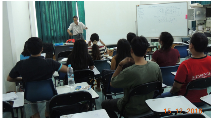
'ဒီပဲမ်(15) & ယူနီဗက်စတီ MES Function Hall WGC Awareness Training on Quality Management Standard ISO 9001:2015 and Environmental Management Standard ISO 14001:2015" ဟု ဟု ဟု