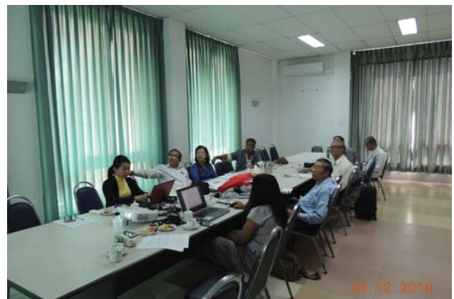
ဒီဇင်ဘာလ(၂၁/၂၈)ရက် နေ့များက MES Meeting Room 1 တွင် WASTAN TD, Special Project Committee & TWG 5 Meeting ပြုလုပ်ခဲ့စဉ်။