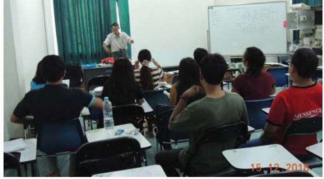
ဒီဇင်ဘာလ(၁၅)ရက်နေ့က MES Training Room 2 တွင် M & E Training ပြုလုပ်ခဲ့စဉ်။