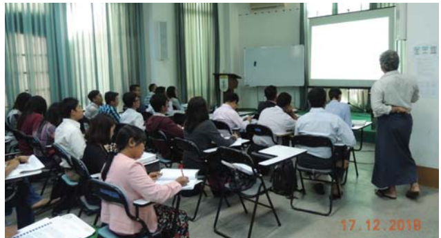
ဒီဇင်ဘာလ(၁၇)ရက်နေ့က Seminar Room တွင် AWE Training ပြုလုပ်ခဲ့စဉ်။