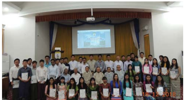
ဒီဇင်ဘာလ(၁၈)ရက်နေ့က Function Hall တွင် Closing Ceremony of 1/2018 STCC Training ပြုလုပ်ခဲ့စဉ်။