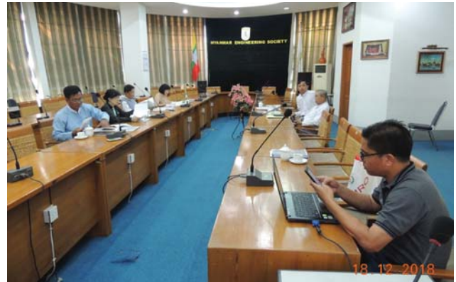
ဒီဇင်ဘာလ(၁၈)ရက် နေ့က MES Conference Room တွင် Meeting between MES & ZKB to discuss on ZKB BOT ပြုလုပ်ခဲ့စဉ်။