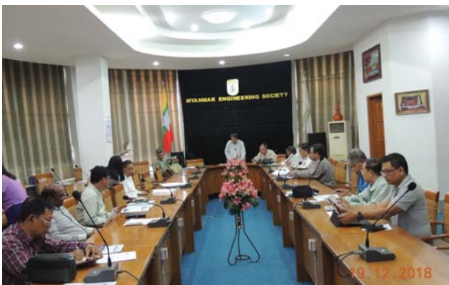
ဒီဇင်ဘာလ(၁၉)ရက် နေ့က MES Conference Room တွင် MICEG Office Bearer Meeting ပြုလုပ်ခဲ့စဉ်။