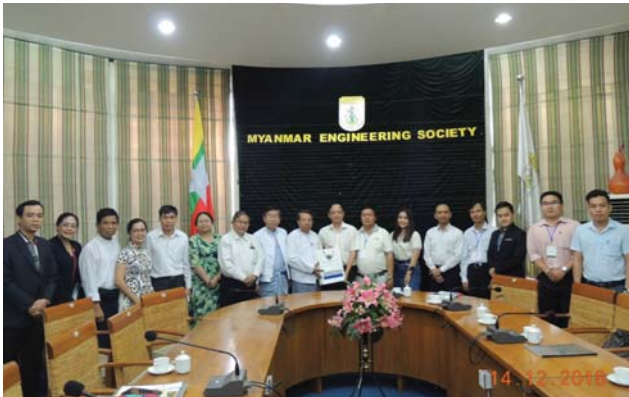
ဒီဇင်ဘာလ(၁၄)ရက် နေ့က MES တွင် Viet Expo နှင့်ပတ်သက်သည့် အစည်းအဝေး ပြုလုပ်ခဲ့စဉ်။