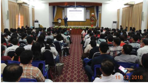
ဒီဇင်ဘာလ(၁၅/၁၆)ရက်နေ့များက MES Function Hall တွင် “Awareness Training on Quality Management Standard ISO 9001:2015 and Environmental Management Standard ISO 14001:2015” ပြုလုပ်ခဲ့စဉ်။