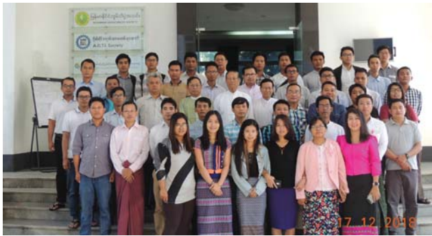
ဒီဇင်ဘာလ(၁၇)ရက်နေ့က Conference Room တွင် AWE Training ဖွင့်ပွဲပြုလုပ်ခဲ့ပြီး မြေညီထုပ်တွင် အမှတ်တရ ဓာတ်ပုံရိုက်ခဲ့စဉ်။