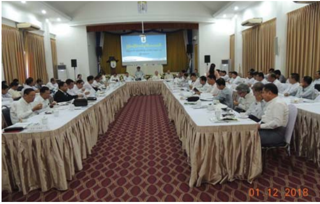
ဒီဇင်ဘာလ(၁)ရက် နေ့က MES Function Hall တွင် မြန်မာနိုင်ငံ အင်ဂျင်နီယာအသင်း စတုတ္ထသုံးလပတ် ဗဟိုကော်မတီအစည်းအဝေးနှင့် စတုတ္ထသုံးလပတ် ဗဟိုကော်မတီဝင်များနှင့် MES Chapter များညှိနှိုင်း အစည်းအဝေး ပြုလုပ်ခဲ့စဉ်။