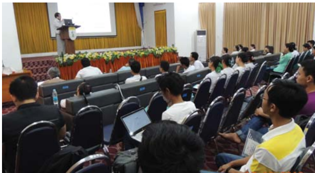
ဒီဇင်ဘာလ(၁၇)ရက်နေ့က Function Hall တွင် MES ငလိုင်ကော်မတီနှင့် မြန်မာ့ ကြက်ခြေနီအဖွဲ့တို့ ပူးပေါင်း၍ သင်တန်းတစ်ရပ်ပြုလုပ်ခဲ့စဉ်။