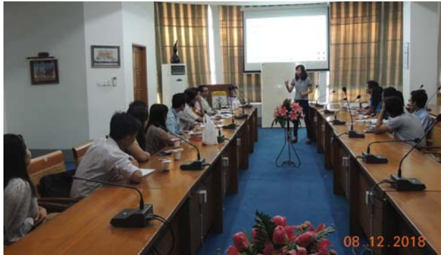
ဒီဇင်ဘာလ(၈)ရက် နေ့က MES Conference Room တွင် “Seminar on Youth & Career” ပြုလုပ်စဉ်။