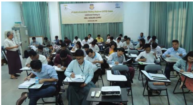
ဒီဇင်ဘာလ(၁၈)ရက်နေ့က Seminar Room တွင် AWE Training ပြုလုပ်ခဲ့စဉ်။