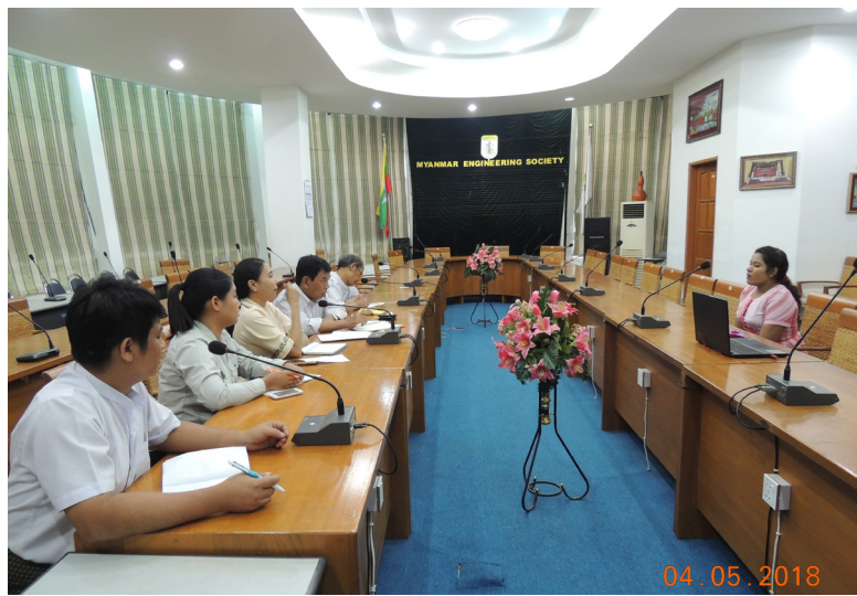
မေလ(၄)ရက်နေ့က MES Conference Room တွင် “Staff Interview for MES” ပြုလုပ်ပါသည်။

နှစ်စဉ်ကျင်းပသော လူငယ်အင်ဂျင်နီယာများ၏ Young Engineer Forum များကျင်းပခြင်း၊ မြန်မာနိုင်ငံအင်ဂျင်နီယာအသင်း၏ တစ်နိုင်ငံလုံးနှစ်စဉ် ကျင်းပသော Process & Product Show အင်ဂျင်နီယာနည်းပညာနှင့် ထုတ်ကုန်များပြပွဲ ကျင်းပခြင်း၊ MES အသင်းခွဲများအားလုံးရှိ YE များပါဝင်သော Annual General Meeting ပြုလုပ်ခြင်း၊ Asean ဒေသရင်း လူငယ်အင်ဂျင်နီယာများ ညီလာခံ YAEFO နှင့် နည်းပညာစာတမ်းများ ဖတ်ကြားခြင်း၊ ပြည်တွင်းပြည်ပအင်ဂျင်နီယာလေ့လာရေးခရီးစဉ်များ သွားရောက်ခြင်း၊ လစဉ် အင်ဂျင်နီယာဘာသာရပ်အလိုက် Seminars; ၊ Workshop များ ပြုလုပ်ခြင်း၊ သင်တန်းများပေးခြင်း၊ Committee အတွက်လိုအပ်သော Project များ၊ Research များ ဆောင်ရွက်ခြင်း၊ အထူးအားဖြင့် မေလ ၂၀၁၈ မှ စတင်၍ YE (V-Crops) အားစတင်ဖွဲ့စည်းပြီး emergency response နှင့် Community Support Program များအား ဆောင်ရွက်လျက်ရှိပါသည်။