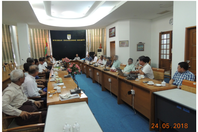
မေလ(၁၀)ရက်နေ့က Meeting Room(1) တွင် MES-YE Volunteer Corps ဖွဲ့စည်းခြင်းအခမ်းအနား အစည်းအဝေး ပြုလုပ်ပါသည်။