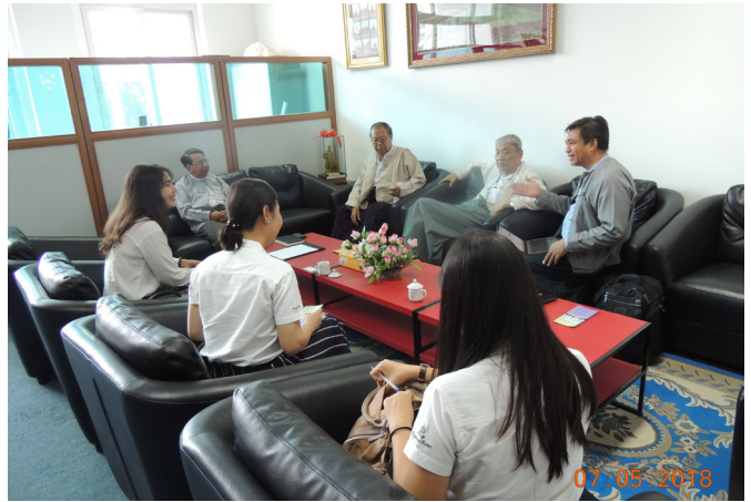
မေလ(၅)ရက်နေ့က MES Conference Room တွင် မြန်မာနိုင်ငံ အင်ဂျင်နီယာအသင်း (၃/၂၀၁၈) ဗဟိုအလုပ်အမှုဆောင် ကော်မတီ အစည်းအဝေး ပြုလုပ်ပါသည်။