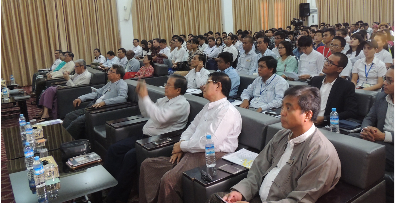
မေလ(၂)ရက်နေ့က MES Function Hall တွင် “Handing Over Ceremony of IAP” ပြုလုပ်ပါသည်။