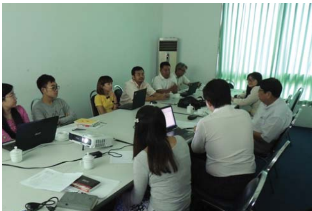
အောက်တိုဘာလ(၂)ရက် နေ့က MES Meeting Room-2 တွင် “Meeting between Myanmar Earthquake Cmt. & Myanmar Red Cross Society” ပြုလုပ်ခဲ့စဉ်။