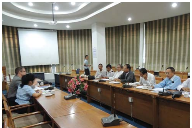
အောက်တိုဘာလ(၂)ရက် နေ့က MES Conference Room တွင် “Meeting between MES and International Finance Corporation (World Bank Group)” ပြုလုပ်ခဲ့စဉ်။