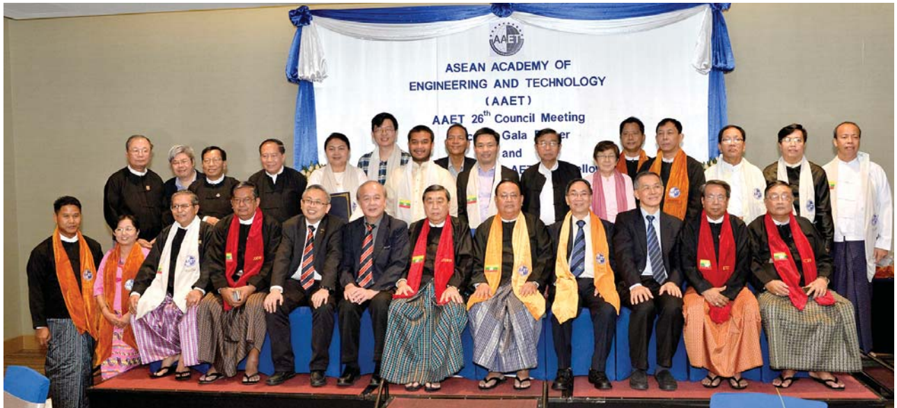
အောက်တိုဘာလ(၂၇)ရက် နေ့က MES Conference Room တွင် “AAET Council Meeting” ပြုလုပ်ခဲ့ပြီး NOVOTEL Hotel တွင် AAET Award Dinner ပြုလုပ်ခဲ့ပြီး အမှတ်တရဓာတ်ပုံ။