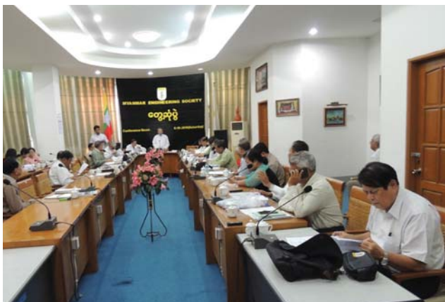
အောက်တိုဘာလ(၃၀)ရက် နေ့က MES Function Hall တွင် ပြုလုပ်သော CAFEO – 36 အတွက် ညှိနှိုင်းအစည်းအဝေး ပြုလုပ်ခဲ့ပါသည်။