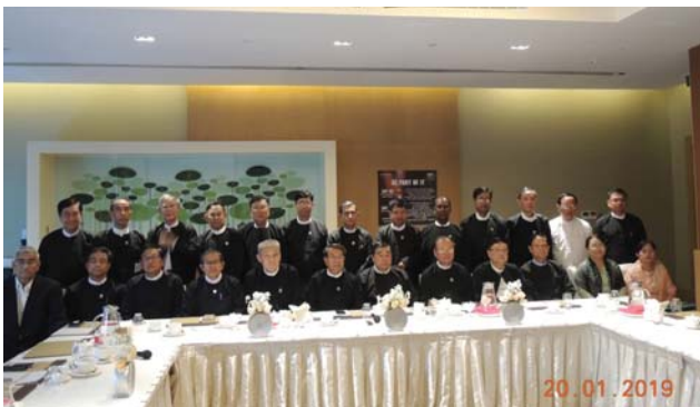
ဇန်နဝါရီလ(၂၀)ရက် နေ့က Novotel Hotel Max Yangon တွင် Fed.MES 1st Office Bearer Meeting ပြုလုပ်ခဲ့စဉ်။