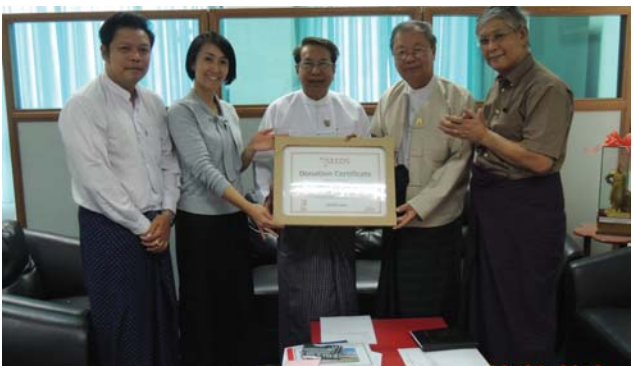
ဇန်နဝါရီလ(၂၆)ရက် နေ့က Fed.MES တွင် ပြုလုပ်သော SEEDs Asia မှ တာဝန်ရှိသူများ၊ PIC အဖွဲ့များနှင့် ဥက္ကဋ္ဌဦးအောင်မြင့် တွေ့ဆုံအစည်းအဝေး ပြုလုပ်ခဲ့ပြီး ဟင်္သာတမြို့နယ်၊ နဘဲကုန်းကျေးရွာ အ.မ.က အတွက် အလှူငွေ ပေးအပ်စဉ်။