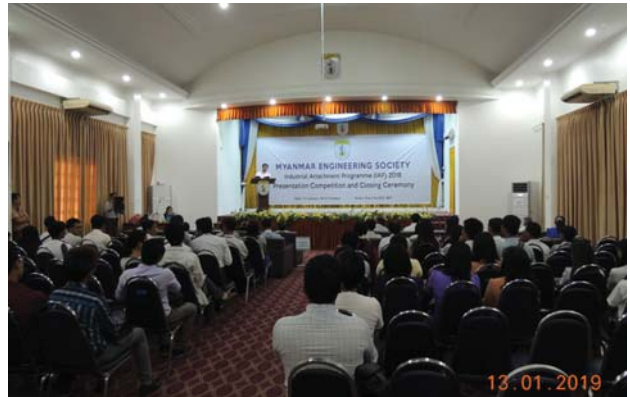
ဇန်နဝါရီလ(၁၃)ရက် နေ့က MES Function Hall တွင် “Closing Ceremony of IAP Program - 2018” ပြုလုပ်ခဲ့စဉ်။