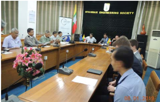
ဇန်နဝါရီလ(၈)ရက် နေ့က MES Conference Room တွင် “MOU Signing Ceremony between Fed.MES & Eurocham” ပြုလုပ်ခဲ့စဉ်။

ဇန်နဝါရီလ(၃)ရက် နေ့ကရွှေတိဂုံစေတီတော်၊ရင်ပြင်တော်တောင်ဘက်ရှေးဟောင်းဗုဒ္ဓရုပ်ပွားတော်များတန်ဆောင်းတွင်ပြုလုပ်သောရွှေတိဂုံစေတီတော် မြတ်ကြီး၏ ကြာမှောက်ကြာလန်ဇရီယာများရှိ ရွှေစင်ပြား (Gold Coating) များ စစ်ဆေးခြင်းနှင့် ရွှေပြားကပ်ရာတွင် အသုံးပြုသည့် ကော်ကိစ္စနှင့် ပတ်သက်၍ စတုတ္ထအကြိမ်မြောက် အစည်းအဝေးသို့ ဥက္ကဋ္ဌဦးအောင်မြင့် တက်ရောက်ခဲ့ပါသည်။