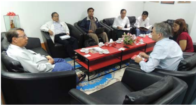
ဇန်နဝါရီလ(၁၁)ရက် နေ့က MES President Office တွင် “Meeting between MES and Embassy of Switzerland” ပြုလုပ်ပါသည်။