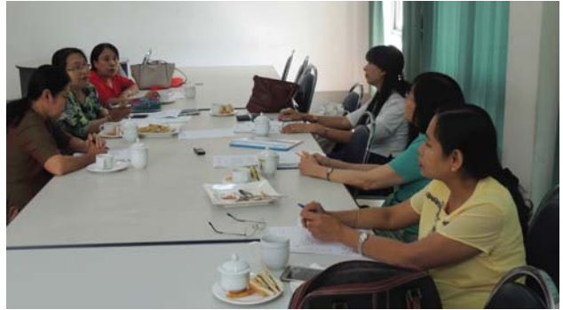
ဇန်နဝါရီလ(၃)ရက် နေ့က MES Meeting Room-1 တွင် Women Engineers Chapter အစည်းအဝေး ပြုလုပ်ပါသည်။