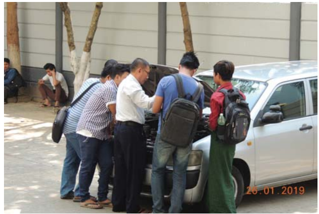
ဇန်နဝါရီလ ၅/၆/၁၃/၂၆/၂၇ ရက်နေ့များက Fed.MES Training Room တွင် Automobile Training ပြုလုပ်ပါသည်။