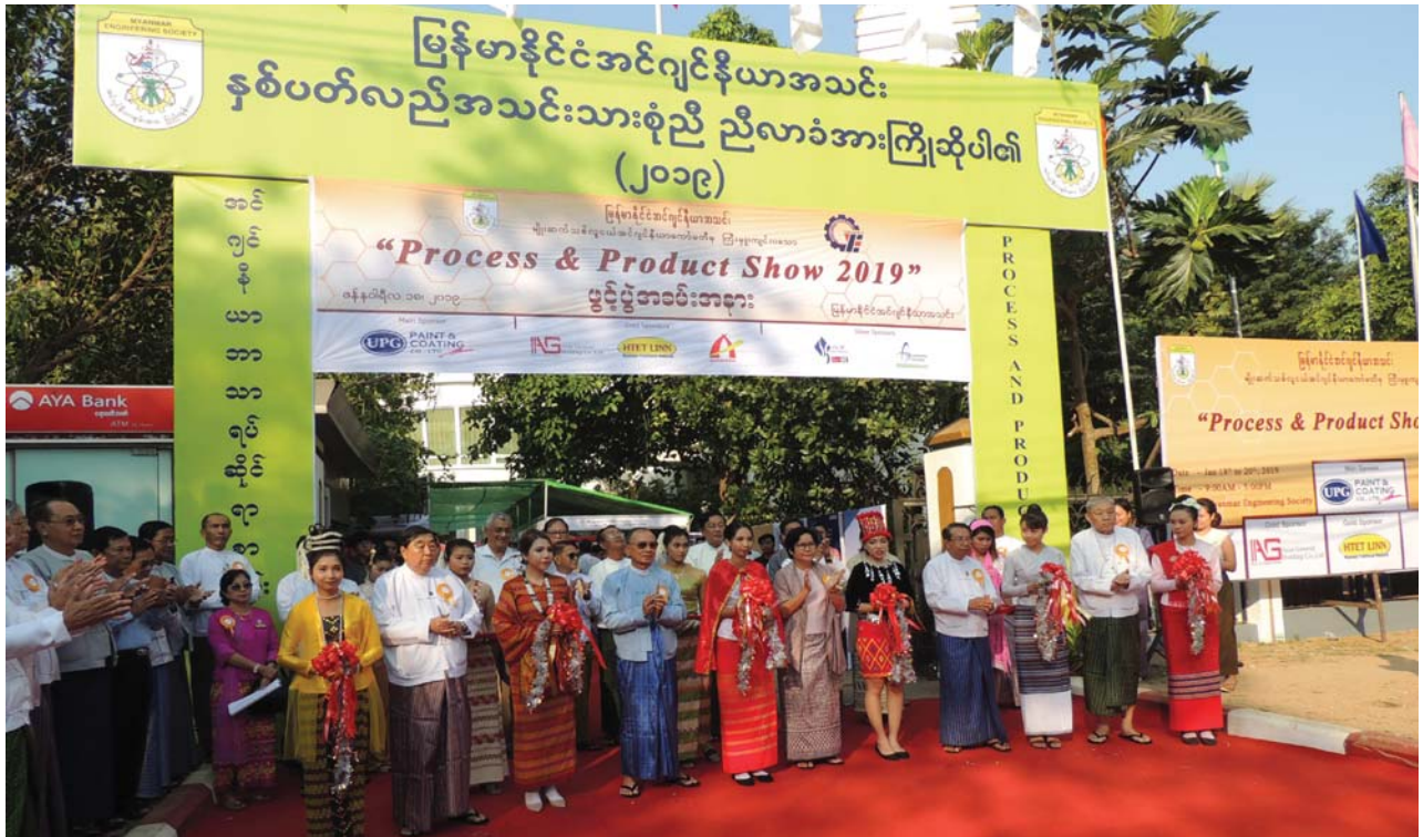
ဇန်နဝါရီလ(၁၈)ရက် နေ့က MES အဆောက်အဦရှေ့တွင် Process and Products Show 2019 ဖွင့်ပွဲပြုလုပ်ခဲ့စဉ်။

မြန်မာနိုင်ငံ အင်ဂျင်နီယာအသင်းချုပ်၏ အသင်းသားများအား အခမဲ့ဖြန့်ဝေသည်။