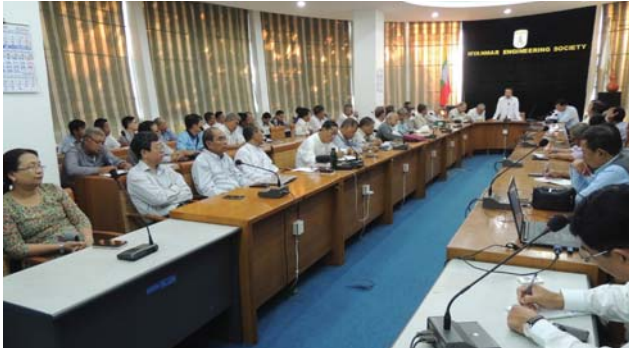
ဇန်နဝါရီလ(၂)ရက် နေ့က MES Conference Room တွင် “Meeting between MES Office Bearer & AGTI Alumni” ပြုလုပ်ပါသည်။