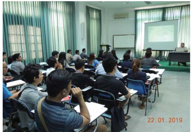
ဇန်နဝါရီလ ၂၂/၂၅/၂၈/၂၉/၃၀/၃၁ ရက်နေ့များတွင် Fed.MES Function Hall တွင် “Opening Ceremony of 1/2019 STCC Training” နှင့် Seminar Room တွင် Lecture များ ပြုလုပ်ခဲ့စဉ်။