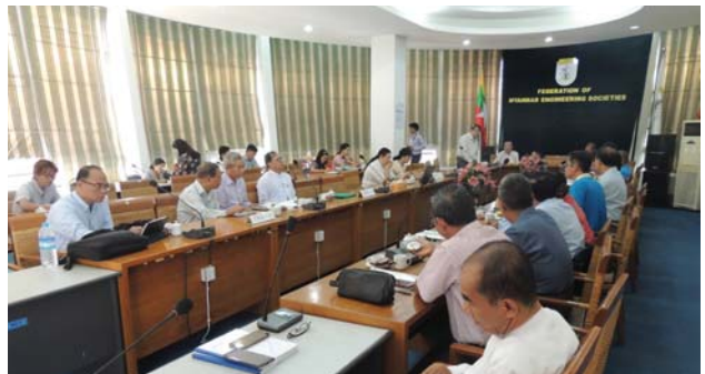
ဗေဇော်ဝါရီလ(၂၃)ရက် နေ့က Fed.MES Conference Room တွင် “Special Project Committee & All TWGs Meeting” ပြုလုပ်ခဲ့စဉ်။