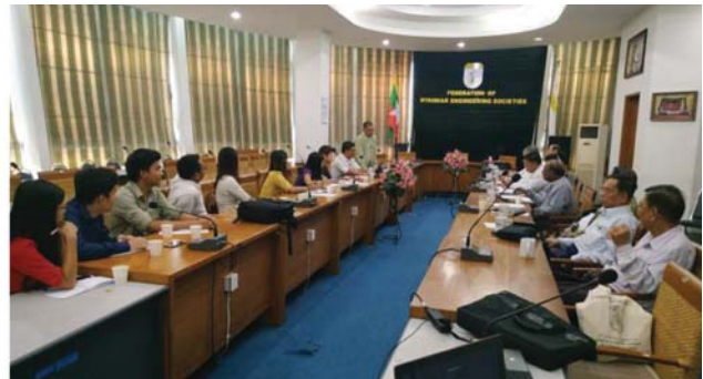
မတ်လ(၉)ရက်နေ့နံနက် (၁၀)နာရီက Young Engineer Committee နှင့် Young Engineer Committee နာယကကြီးများ အစည်းအဝေးကို Fed.MES ပထမထပ်ရံ Conference Room တွင် ကျင်းပပြုလုပ်ခဲ့ပြီး။ Young Engineer Committee တိုးချဲ့ဖွဲ့စည်းခြင်းနှင့် ၂၀၂၀-ခုနှစ်များတွင် တိုးမြှင့်ဆောင်ရွက်မည့် လုပ်ငန်းစဉ်များကိုတင်ပြရာ နာယကကြီးများက လိုအပ်သောအကြံဉာဏ်ကို လမ်းညွှန်မှုများ ပြုလုပ်ခဲ့ပါသည်။