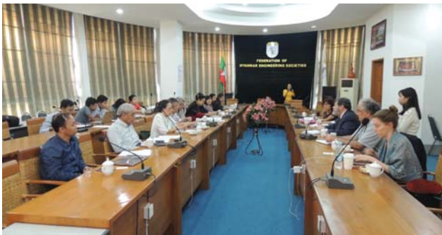
ဗေဇော်ဝါရီလ(၂၆)ရက် နေ့က Fed.MES Conference Room တွင် “Meeting between Myanmar Earthquake Cmt. & World Bank” ပြုလုပ်ခဲ့စဉ်။