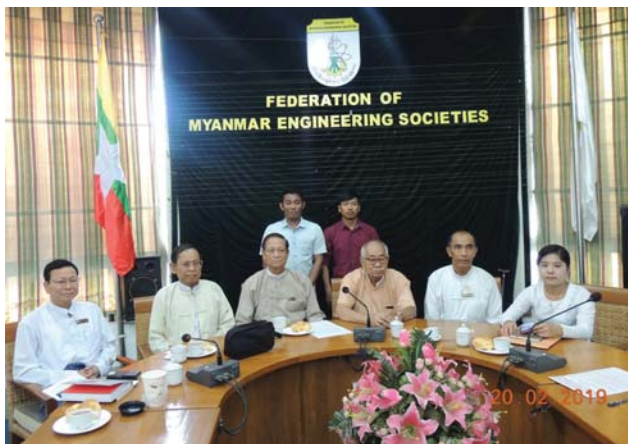
ဖေဖော်ဝါရီလ(၂၀)ရက်နေ့က Fed.MES Conference Room တွင် “Bond Signing Ceremony between JFE Trainees and Fed. MES” ပြုလုပ်ခဲ့စဉ်။