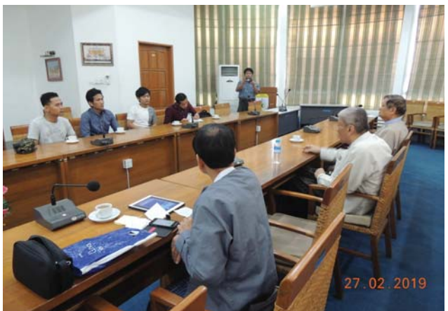
ဖေဖော်ဝါရီလ(၂၇)ရက်နေ့က Fed.MES Conference Room တွင် “Seminar on Experiences of JFE Returnees on JFE Training” ပြုလုပ်ခဲ့စဉ်။