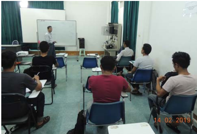
ဖေဖော်ဝါရီလ(၁၄)ရက်နေ့က Fed.MES Computer Room တွင် “Lecture on Welding Technology and Safety” ပြုလုပ်ခဲ့စဉ်။