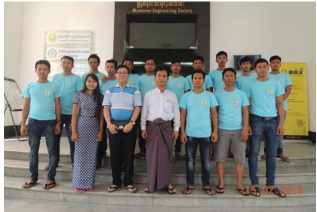
ဖေဖော်ဝါရီလ(၁၅)ရက်နေ့က Fed.MES Computer Room တွင် Exam for Welding Technology and Safety” ပြုလုပ်ခဲ့ပြီးစုပေါင်း ဓာတ်ပုံရိုက်ခဲ့ကြစဉ်။