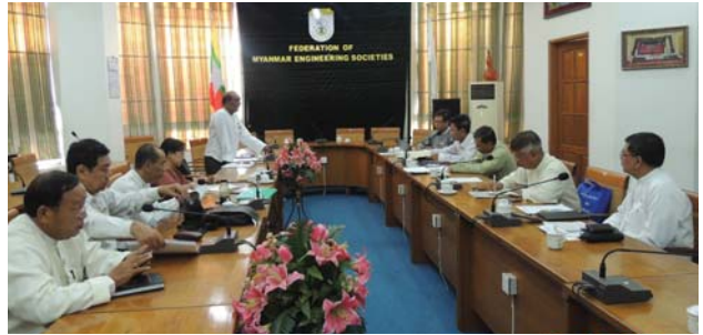
ဗေဇော်ဝါရီလ(၁၉)ရက် နေ့က Fed.MES Conference Room တွင် “Fed.MES Secretariat Meeting” ပြုလုပ်ခဲ့စဉ်။