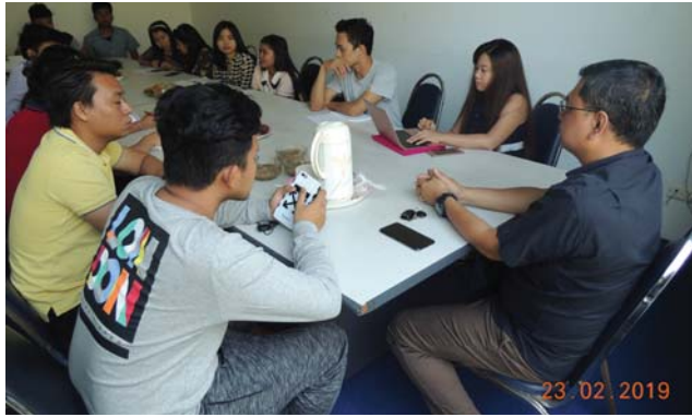
ဖေဖော်ဝါရီလ(၂၃)ရက်နေ့က Fed.MES Meeting Room-2 တွင် “Regular Monthly Meeting of YE Committee” ပြုလုပ်ခဲ့စဉ်။