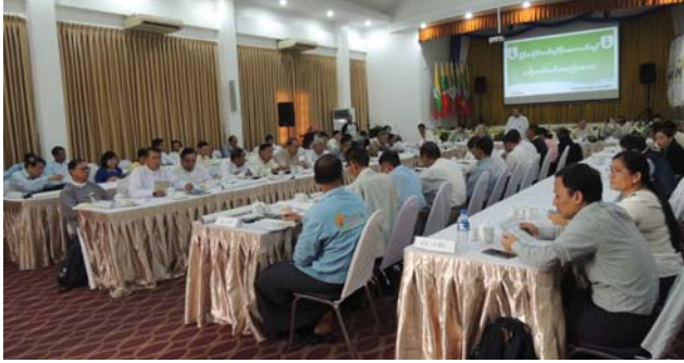
ဗေဇော်ဝါရီလ(၂)ရက် နေ့က Fed.MES Function Hall တွင် မြန်မာနိုင်ငံ အင်ဂျင်နီယာအသင်းချုပ် ဗဟိုကော်မတီအစည်းအဝေး ပြုလုပ်ခဲ့စဉ်။