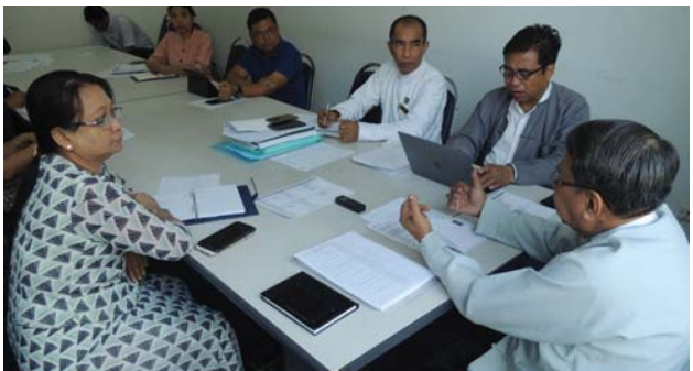
ဗေဇော်ဝါရီလ(၂၂)ရက် နေ့က Fed.MES Meeting Room-2 တွင် AFEO Committee အစည်းအဝေး ပြုလုပ်ခဲ့စဉ်။