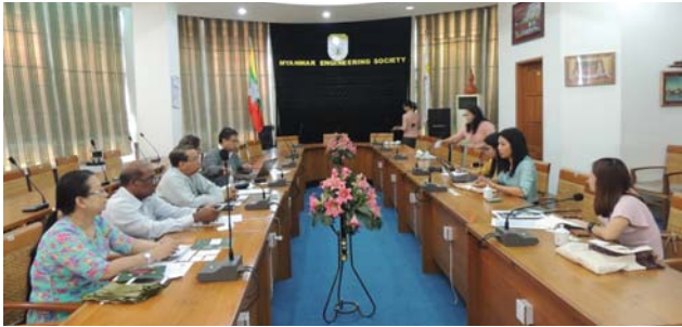
ဗေဇော်ဝါရီလ(၈)ရက် နေ့က Fed.MES Conference Room တွင် “Meeting between Fed.MES and Willis Towers Watson Brokers (Singapore) Pte. Ltd. ပြုလုပ်ခဲ့စဉ်။