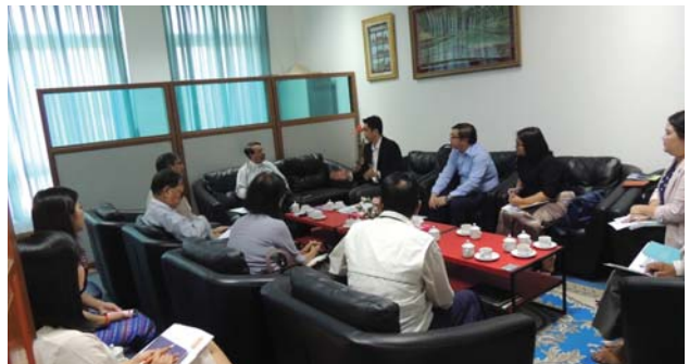
ဗေဇော်ဝါရီလ(၂၆)ရက် နေ့က Fed.MES President Office တွင် WATSAN TD နှင့် UBM အစည်းအဝေး ပြုလုပ်ခဲ့စဉ်။