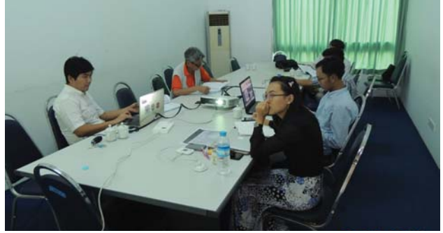
ဗေဇော်ဝါရီလ(၅)ရက် နေ့က Fed.MES Meeting Room-2 တွင် “Meeting with AIT Solution for UN Project” ပြုလုပ်ခဲ့စဉ်။