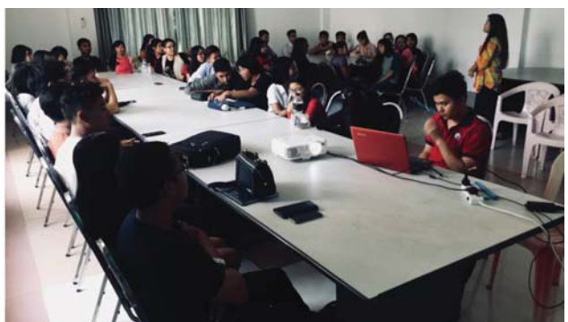
မတ်လ (၃) ရက်နေ့က YE တွဲဖက်အတွင်းရေးမှူး (၄) ဦးတို့နှင့် တွဲဖက်ဆောင်ရွက်ရန်အတွက် YE ကော်မတီမှ မျိုးဆက်သစ်လူငယ် အစုအဖွဲ့(၄)ဖွဲ့ဖွဲ့စည်းပြီး တစ်ဖွဲ့လျှင် Team Leader (၁) ဦးစီထားရှိနိုင်ရေးအတွက် voting စနစ်ဖြင့် ရွေးချယ်တာဝန်ပေးအပ်ခဲ့ပါသည်။