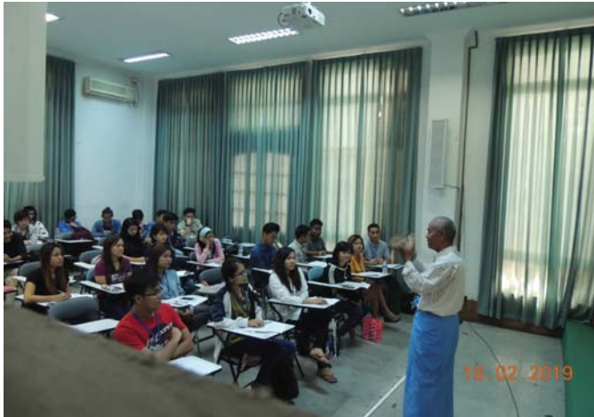
ဖေဖော်ဝါရီလ ၁၈/၁၉/၂၀၁၉ တွင် “Lecture for 1/2019 STCC Training” များပြုလုပ်ခဲ့စဉ်။