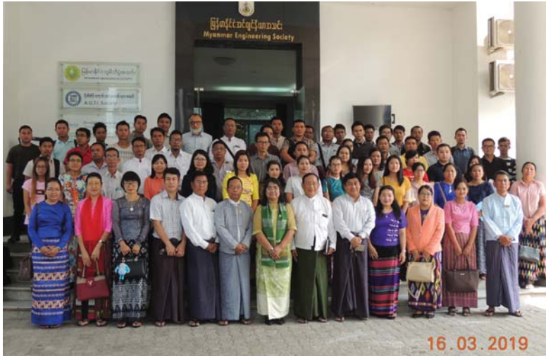
မတ်လ(၃)ရက်တနင်္ဂနွေနေ့က Fed.MES Conference Room တွင် “Closing and Certification Ceremony of (OBD-2) Vehicle Diagnosis and Repairing Training” ပြုလုပ်ပါခဲ့သည်။