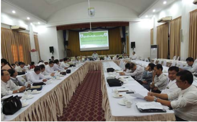
မတ်လ(၉)ရက် နေ့က Fed.MES Function Hall တွင် မြန်မာနိုင်ငံ အင်ဂျင်နီယာအသင်းချုပ် ပထမသုံးလပတ်ဗဟိုကော်မတီ အစည်းအဝေးနှင့် ပထမသုံးလပတ် ဗဟိုကော်မတီဝင်များနှင့် MES Chapter များညှိနှိုင်း အစည်းအဝေး ပြုလုပ်ခဲ့ပါသည်။