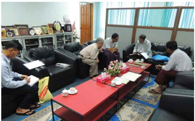
မတ်လ(၁၉)ရက် နေ့က Fed.MES President Office တွင် “Meeting of President of Fed.MES with Alliance Stars Engineering Co., Ltd.” ပြုလုပ်ပါသည်။