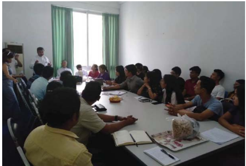
မတ်လ(၃၀)ရက်နေ့က Young Engineer Committee ၏ လစဉ် Meeting ကို ကျင်းပခဲ့ပါသည်။