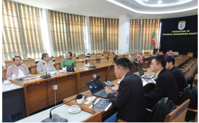
မတ်လ(၁၃)ရက် နေ့က Fed.MES Conference Room တွင် “Meeting between Fed.MES and HUAWEI Technology (Ygn) Co., Ltd.” ပြုလုပ်ခဲ့ပါသည်။