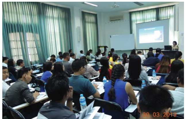
မတ်လ(၁၆/၁၇/၂၃/၂၄/၃၀/၃၁)ရက်နေ့များက, Fed.MES Seminar Room တွင် Chemical Safety Course Training ပြုလုပ်ပါသည်။