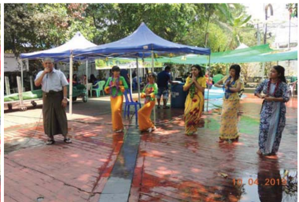
ဧပြီလ (၁၀) ရက်နေ့က Young Engineer Committee ၏ YE သင်္ကြန်ကျင်းပခဲ့ပြီး မုန့်လုံးရေပေါ်၊ ထမင်း၊ ရွှေရင်အေး စတုဒိသာများကို ဧည့်ခံကျွေးမွေးပြီး သင်္ကြန်သီချင်းဖြင့် သီဆိုဖြေဖျော် ခဲ့ကြပါသည်။