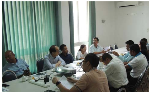
မတ်လ(၁၄/၂၉)ရက် နေ့က Fed.MES Meeting Room-1 တွင် Air-con & Refrigeration TD Meeting ပြုလုပ်ပါသည်။