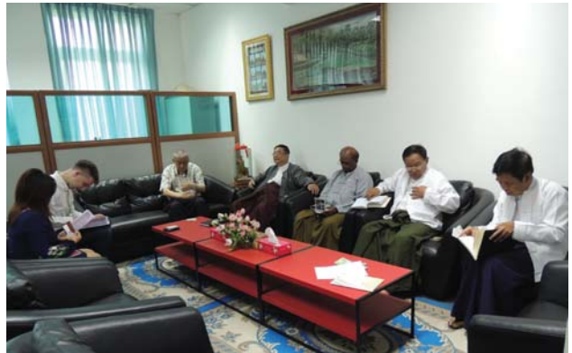
မတ်လ(၁၄)ရက် နေ့က Fed.MES Conference Room တွင် “Meeting between Fed.MES and Delegation of German Industry and Commerce in Myanmar” ပြုလုပ်ခဲ့ပါသည်။