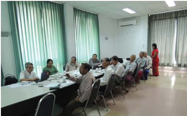
မတ်လ(၁၃)ရက် နေ့က Fed.MES Meeting Room-1 တွင် New Building Committee Meeting ပြုလုပ်ပါသည်။