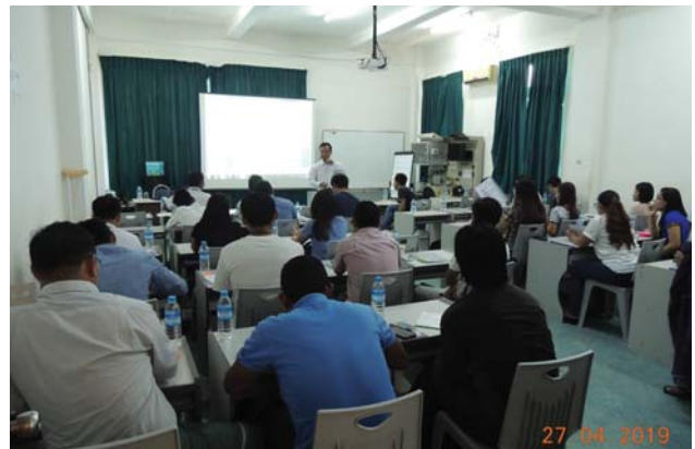
ဧပြီလ ၂၇/ ၂၈ ရက်နေ့များက Fed.MES Training Room တွင် “WE – Pretraining” ပြုလုပ်ပါသည်။