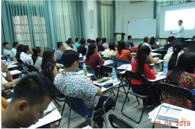
ဧပြီလ၆/၇ရက်နေ့များက Fed.MES Seminar Room တွင် Chemical Safety & Sanitation Training ပြုလုပ်ပါသည်။