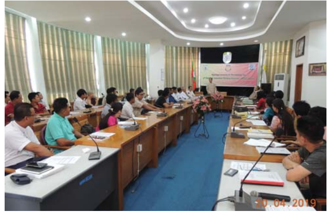
ဧပြီလ(၂၀)ရက်နေ့က Fed.MES Conference Room တွင် “Opening Ceremony of AWE - Training” ပြုလုပ်ပါသည်။