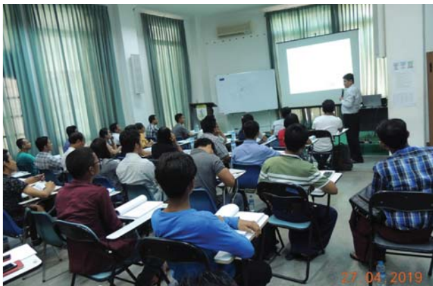
ဧပြီလ ၂၀/ ၂၁/ ၂၇/ ၂၈ ရက်နေ့များက Fed.MES Seminar Room တွင် “Lecture of AWE Training” ပြုလုပ်ပါသည်။