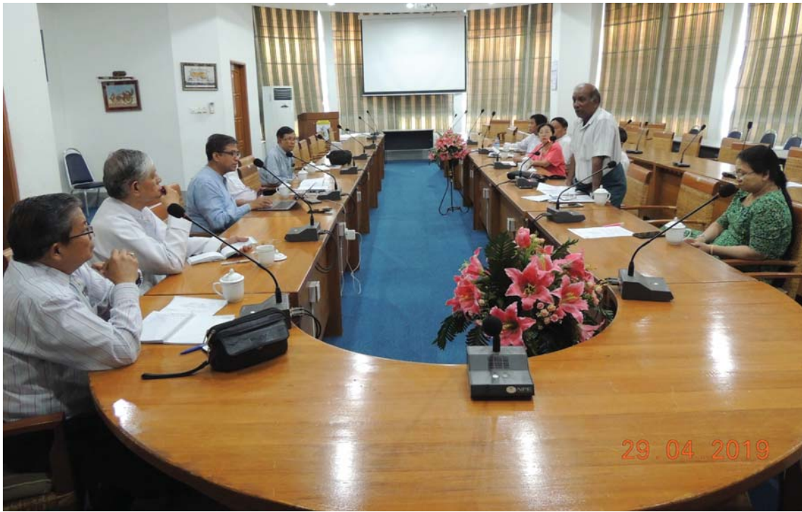
ဧပြီလ(၂၉)ရက် နေ့က Fed.MES Conference Room တွင် Fed.MES, Management Meeting ပြုလုပ်ပါသည်။