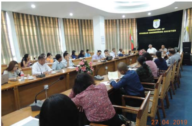
ဧပြီလ(၂၇)ရက်နေ့က Fed.MES Conference Room တွင် “Opening Ceremony of WE – Pretraining” ပြုလုပ်ပါသည်။