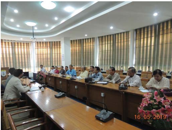
မေလ(၁၆)ရက် နေ့က Fed.MES Conference Room တွင် “Meeting between Fed.MES and GIZ” ပြုလုပ်ခဲ့ပါသည်။