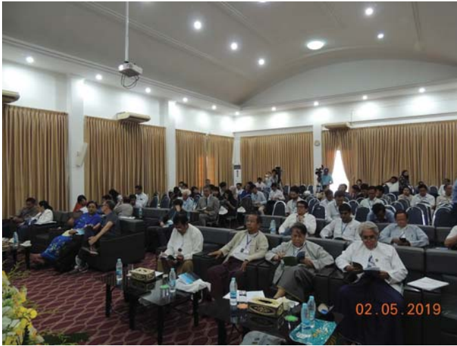
မေလ(၂)ရက် နေ့က Fed.MES Function Hall တွင် “The 7th International Workshop on Seismotectonics in Myanmar & Earthquake Risk Management” ပြုလုပ်ခဲ့ပါသည်။