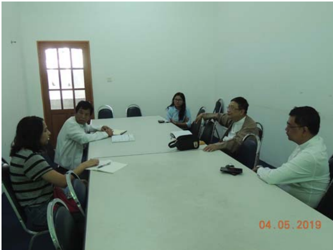
မေလ(၄)ရက် နေ့က Fed.MES Meeting Room-2 တွင် “Coordination Meeting for JDS Knowledge Sharing Seminar” ပြုလုပ်ခဲ့ပါသည်။