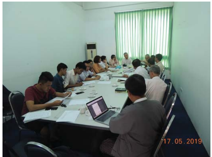
မေလ(၁၇/၁၈)ရက် နေ့များက Fed.MES Meeting Room-2 တွင် Meeting of Fed.MES History Compilation Committee ပြုလုပ်ခဲ့ပါသည်။