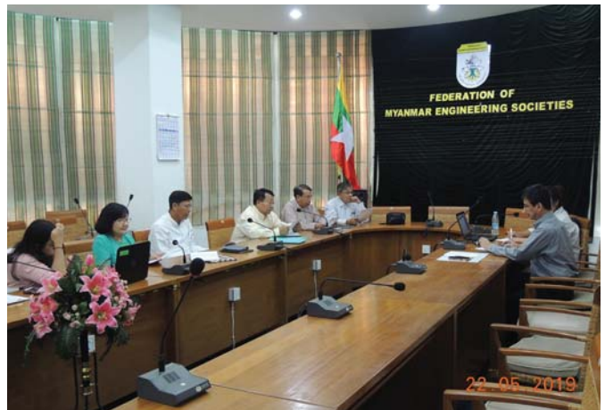
မေလ(၂၂)ရက် နေ့က Fed.MES Conference Room တွင် “Meeting between Fed.MES& Su Foundation” ပြုလုပ်ခဲ့ပါသည်။