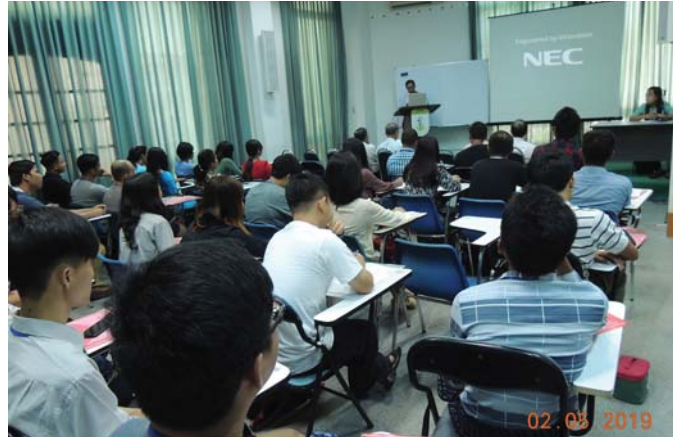
မေလ ၂/၃/၆-၉/၁၃-၁၇/၂၀-၂၄/၂၇-၃၁ ရက်နေ့များတွင်, Fed.MES Seminar Room တွင် “2/2019 STCC Training” များပြုလုပ်ခဲ့ပါသည်။