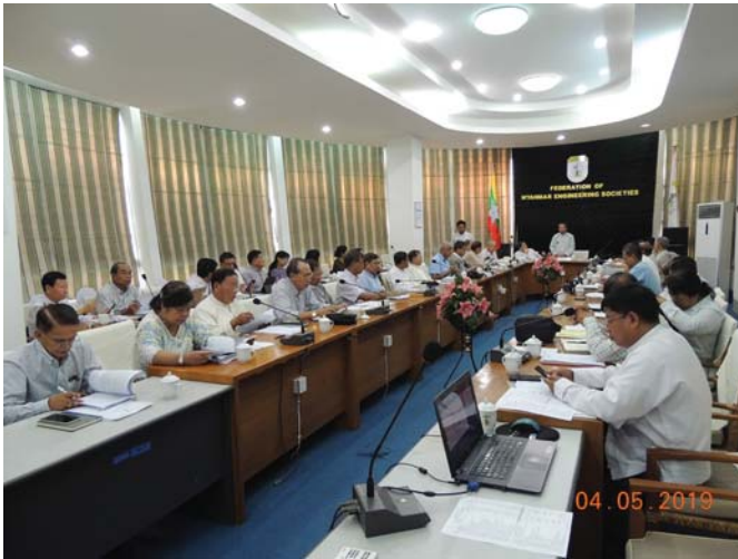
မေလ(၄)ရက် နေ့က Fed.MES Conference Room တွင် Fed.MES, (2/2019) CEC Meeting ပြုလုပ်ခဲ့ပါသည်။