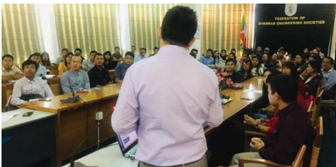
မေလ(၃၁)ရက် နေ့တွင် လူငယ်အင်ဂျင်နီယာကော်မတီမှ ကြီးပွား၍ BIM Design and Digital Engineers အကြောင်းကိုဟောပြောခဲ့ပါသည်။