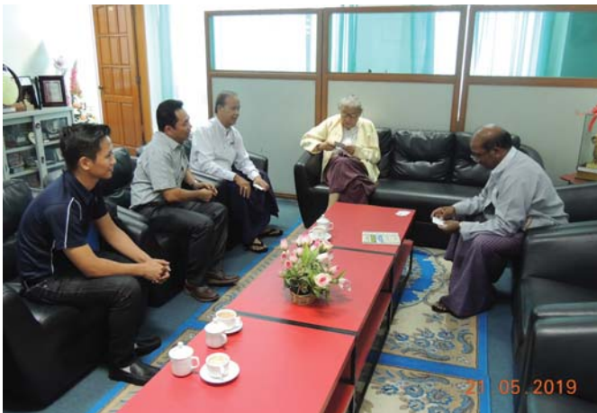
မေလ(၂၁)ရက် နေ့က Fed.MES President Office တွင် “Meeting between Fed.MES and ShweEin Company Ltd.” ပြုလုပ်ခဲ့ပါသည်။