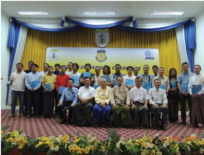
မေလ(၁၁)ရက်နေ့က Fed.MES Function Hall တွင် “Certification Ceremony of AWE Training” ပြုလုပ်ခဲ့ပါသည်။