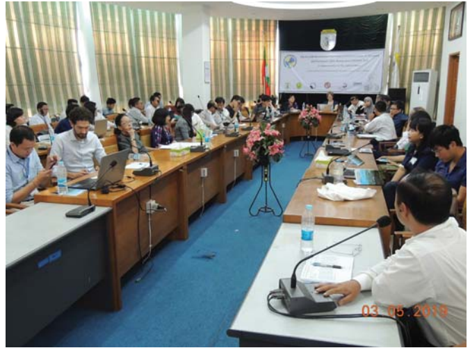
မေလ(၃)ရက် နေ့က Fed.MES Function Hall, Meeting Room-1, Conference တို့တွင် “The 7th International Workshop on Seismotectonics in Myanmar & Earthquake Risk Management” ပြုလုပ်ခဲ့ပါသည်။