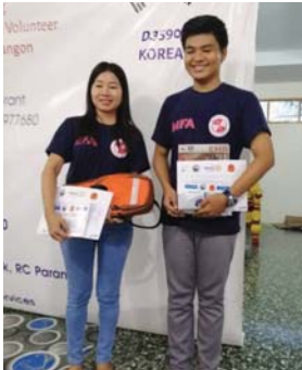
မေလ(၁၃)ရက် မှစတင်၍မေလ(၂၄)ရက်နေ့ထိ Rotary Club of Yangon က ကြီးပွားကျင်းပသည့် Emergency Medical Responder (EMR) သင်တန်းကို မြန်မာနိုင်ငံအင်ဂျင်နီယာအသင်းချုပ်၊ လူငယ်အင်ဂျင်နီယာကော်မတီမှ လူငယ်အင်ဂျင်နီယာ (၆)ဦးအား သင်တန်းတက်ရောက်ရန်လွှတ်ခဲ့ပြီးပထမဆုံးနှင့် ဒုတိယဆုများကိုထူးချွန်စွာ ရရှိခဲ့ပါသည်။