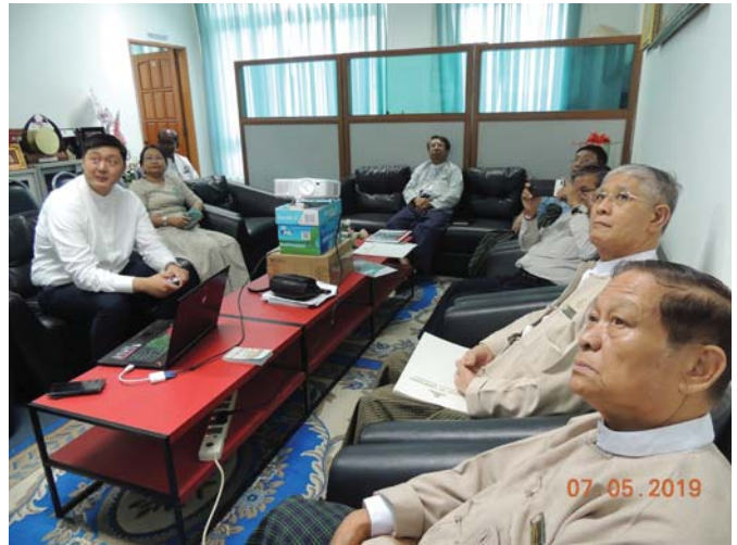
မေလ(၇)ရက် နေ့က Fed.MES President's Office တွင် “Meeting between Fed.MES& Jewelry Luck Group of Cos.” ပြုလုပ်ခဲ့ပါသည်။