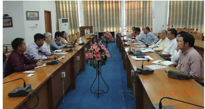
မေလ(၁၀)ရက် နေ့က Fed.MES Conference Room တွင် “Meeting of Energy & Renewable Energy Committee & Y.E Committee” ပြုလုပ်ခဲ့ပါသည်။