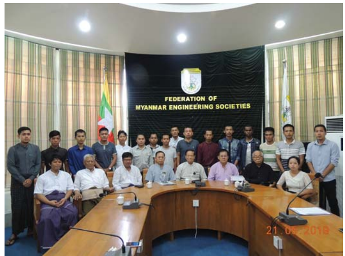
မေလ ၃၁ ရက်နှင့် ၂၃၊ ၂၄ ရက်နေ့များက Fed.MES Conference Room တွင် 30th & 31th Automotive products, Development Technical Committee meeting concerning with UNR 22, safety helmet ဆိုင်ရာပြုလုပ်ခဲ့ပါသည်