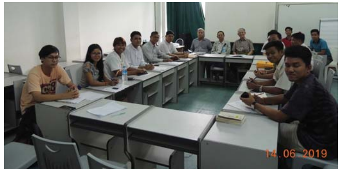
ဇွန်လ(၁၄)ရက်နေ့က, Fed.MES Training Room တွင် “Coordination Meeting of Fed.MES History Compilation Cmt.” ပြုလုပ်ခဲ့ပါသည်။