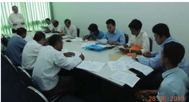
ဇွန်လ(၂၈)ရက်နေ့က, Fed.MES Training Room တွင် “MES History” ပြုစုရေး အစည်းအဝေး ပြုလုပ်ခဲ့ပါသည်။