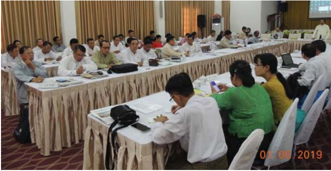
ဇွန်လ(၁)ရက်နေ့က, Fed.MES Function Hall တွင် မြန်မာနိုင်ငံ အင်ဂျင်နီယာအသင်းချုပ် ဒုတိယသုံးလပတ် ဗဟိုကော်မတီအစည်းအဝေး ပြုလုပ်ခဲ့ပါသည်။