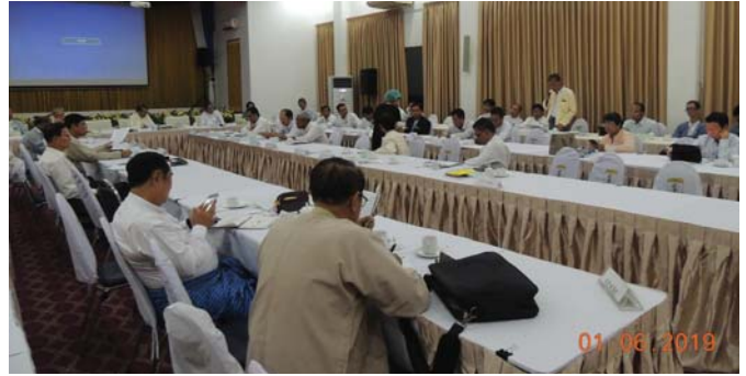
ဇွန်လ(၁)ရက်နေ့က, Fed.MES Function Hall တွင် မြန်မာနိုင်ငံ အင်ဂျင်နီယာအသင်းချုပ် ဒုတိယသုံးလပတ် ဗဟိုကော်မတီဝင်များနှင့် MES Chapter များညှိနှိုင်းအစည်းအဝေး ပြုလုပ်ခဲ့ပါသည်။