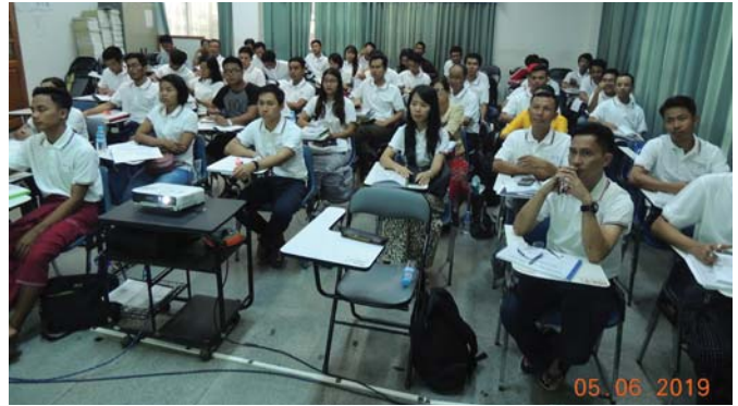
ဇွန်လ(၅)ရက်နေ့က, Fed.MES Seminar Room တွင် “Opening of AWE Training” ပြုလုပ်ပါသည်။