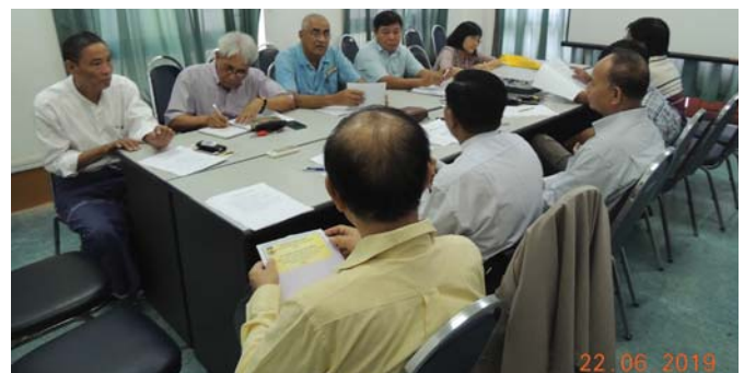
ဇွန်လ(၂၂)ရက်နေ့က, Fed.MES Meeting Room-3 တွင် “Coordination Meeting of MSCE” ပြုလုပ်ခဲ့ပါသည်။