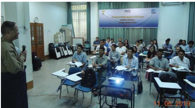
ဇွန်လ ၁၀-၁၄ရက်နေ့များတွင်, Fed.MES Seminar Room တွင် “Lecture of 2nd Batch of JWE Welding Training” ပြုလုပ်ပါသည်။