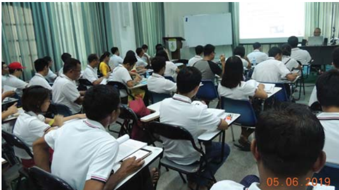
ဇွန်လ၅-၆ရက်နေ့များတွင်, Fed.MES Seminar Room တွင် “Lecture of AWE Training” ပြုလုပ်ပါသည်။