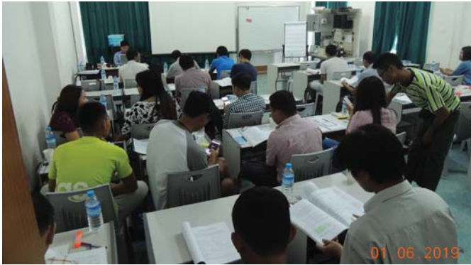
ဇွန်လ၁/၂/ရက်နေ့များတွင်, Fed.MES Training Room တွင် “WE – Pretraining” ပြုလုပ်ပါသည်။