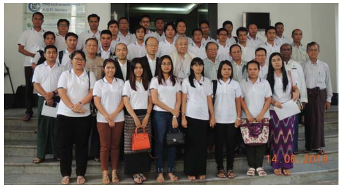
ဇွန်လ(၁၄)ရက်နေ့က, Fed.MES Conference Room တွင် “Closing Ceremony of WE Training” ပြုလုပ်ပြီး စုပေါင်းဓာတ်ပုံရိုက်ကြပါသည်။