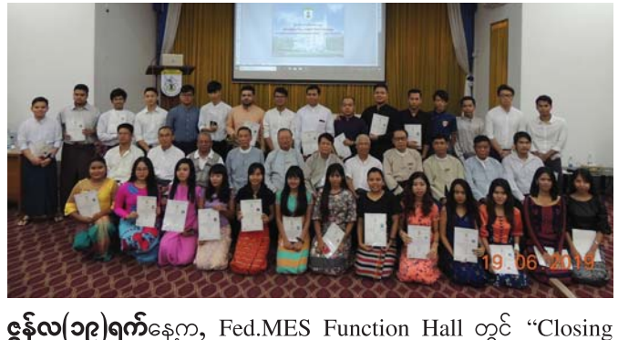
ဇွန်လ(၁၉)ရက်နေ့က, Fed.MES Function Hall တွင် “Closing Ceremony of 2/19 STCC Training” ပြုလုပ်ပြီး စုပေါင်းဓာတ်ပုံရိုက်ကြပါသည်။