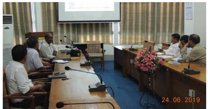
ဇွန်လ(၂၄)ရက်နေ့က, Fed.MES Conference Room တွင် “Fed.MES Management Committee Meeting” ပြုလုပ်ခဲ့ပါသည်။