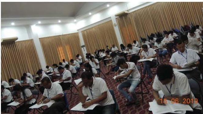
ဇွန်လ၁၅/၁၆ရက်နေ့များတွင်, Fed.MES Function Hall တွင် “AWE Exam” ပြုလုပ်ပါသည်။