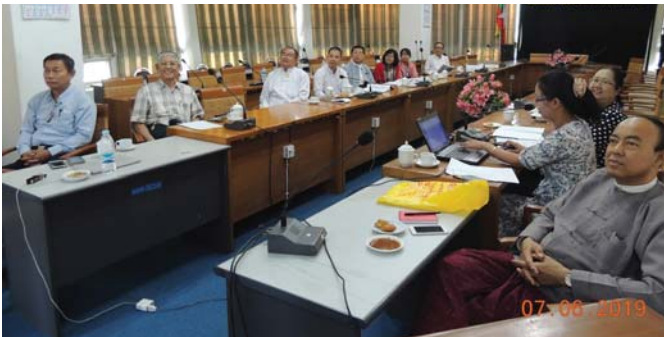
ဇွန်လ(၇/၇/၂၀/၂၁)ရက်နေ့များက, Fed.MES Conference Room တွင် “Coordination Meeting between Auto T.D of Fed.MES & Ministry of Industry” ပြုလုပ်ခဲ့ပါသည်။