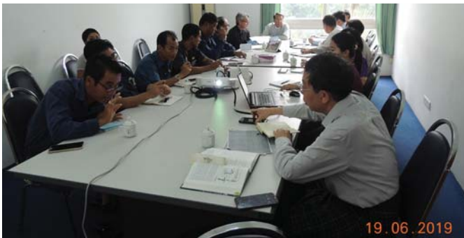
ဇွန်လ(၁၉)ရက်နေ့က, Fed.MES Meeting Room-2 တွင် “Coordination Meeting of Special Project Committee to Discuss on Mandalay Hill Project & Nga Moe Yeik Water Treatment Plant Reports” ပြုလုပ်ခဲ့ပါသည်။