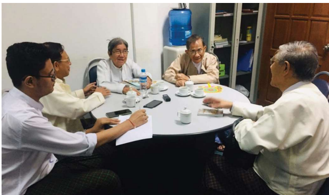
အောက်တိုဘာလ (၂၅)ရက်နေ့တွင် Young Engineer Committee မှ လူငယ်အင်ဂျင်နီယာများသည့် History Committee ၏ သမိုင်း ပြုစုရေးလုပ်ငန်းများတွင် ပါဝင်လုပ်ကိုင်ခဲ့ကြပါသည်။