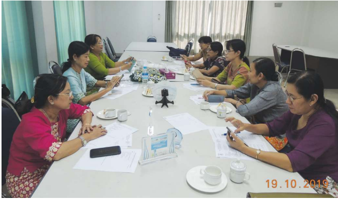
အောက်တိုဘာလ(၁၉)ရက် နေ့က Fed.MES Meeting Room-1 တွင် Women Engineers Chapter အစည်းအဝေး ပြုလုပ်ခဲ့စဉ်။