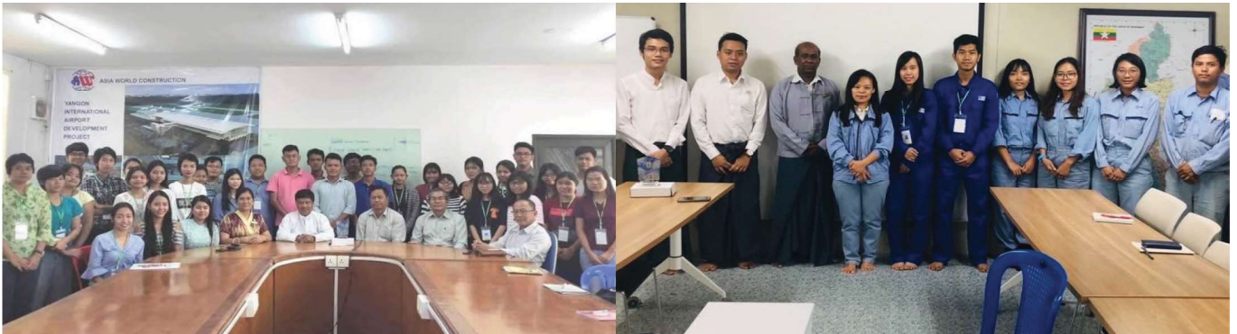
အောက်တိုဘာ (၂၂)ရက် (၂၃)ရက် များတွင် Young Engineer Committee မှ IAP Supervision သွားရောက်ခဲ့ကြပါသည်။