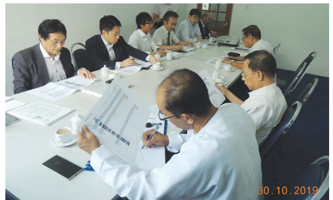
အောက်တိုဘာလ(၃၀)ရက် နေ့က Fed.MES Meeting Room 2 တွင် Fed.MES နှင့် JFE အဖွဲ့တို့ 5th Batch Pipeline Welding Training အတွက် Result Meeting ပြုလုပ်ခဲ့စဉ်။