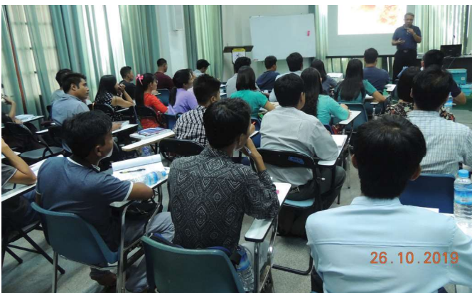
အောက်တိုဘာလ(၂၆/ ၂၇)ရက် နေ့များက Fed.MES Seminar Room တွင် ‘AWE Training’ များ ပြုလုပ်ခဲ့စဉ်။