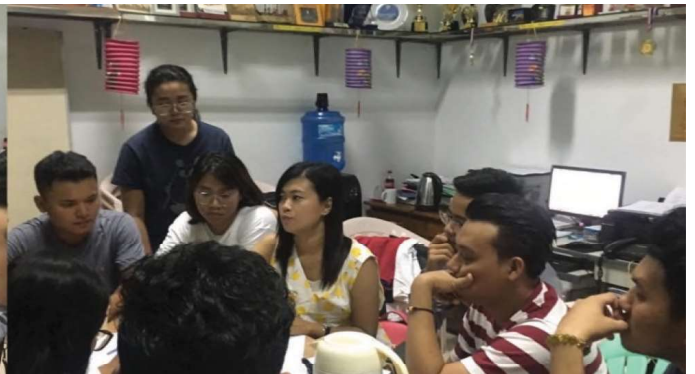
အောက်တိုဘာလ (၂၇) ရက်နေ့တွင် YE Office တွင် Young Engineer Committee ၏ ၂၀၂၀-ခုနှစ်၊ ဇန်နဝါရီလတွင် ကျင်းပပြုလုပ်မည့် Process and Product Show ပွဲအတွက် အစည်းအဝေးနှင့် Land Surveying ပြုလုပ်ခဲ့ကြပါသည်။