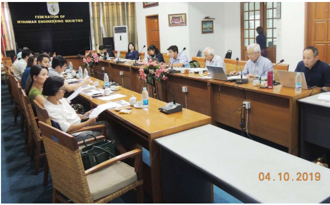
အောက်တိုဘာလ(၄)ရက် နေ့က Fed.MES Conference Room တွင် ‘Training Workshop of Myanmar Earthquake Cmt. & Ministry of Land, Infrastructure, Transport and Tourism (Japan)’ ပြုလုပ်ခဲ့စဉ်။