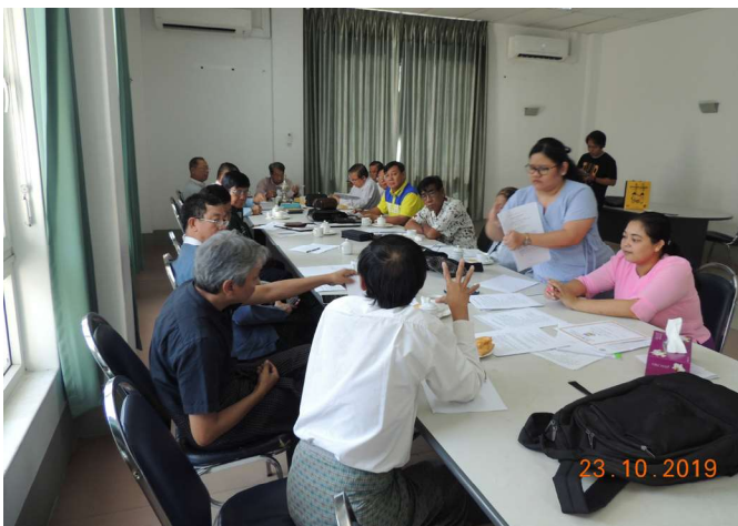
အောက်တိုဘာလ(၂၃)ရက် နေ့များက Fed.MES Meeting Room -1 တွင် MSCE Coordination Meeting များပြုလုပ်ပါခဲ့စဉ်။