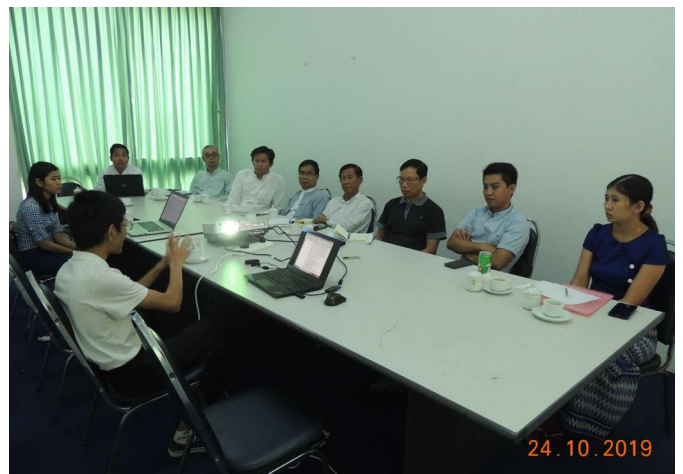
အောက်တိုဘာလ(၂၄)ရက် နေ့က Fed.MES Meeting Room-2 တွင် ‘Meeting between Environmental Committee of Fed.MES and MAPCO, MEXICO, MAGPL companies for revision of EIA Reports for Thilawa Plot 27,28, and 29’ ပြုလုပ်ခဲ့စဉ်။