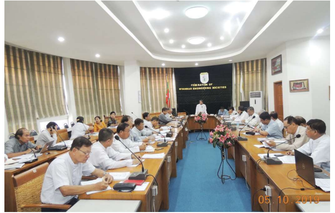
အောက်တိုဘာလ(၁)ရက် နေ့က Fed.MES Conference Room တွင် Fed.MES Management Committee Meeting ပြုလုပ်ခဲ့စဉ်။