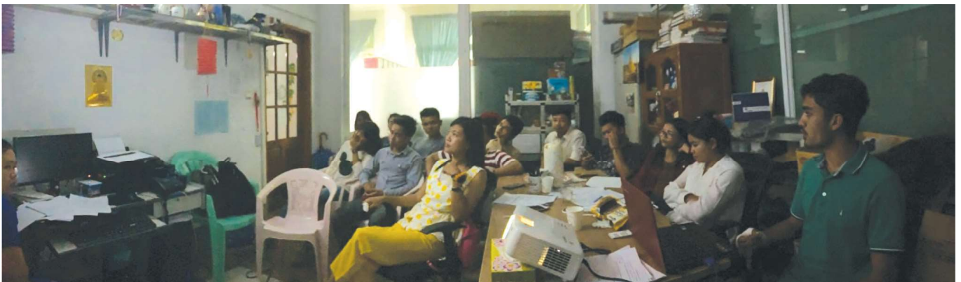
အောက်တိုဘာလ (၂၉) ရက်နေ့တွင် YE Office တွင် Young Engineer Committee ၏ ဥက္ကဋ္ဌ၊ ဒုတိယဥက္ကဋ္ဌ တို့မှ YE- Application နှင့် ပတ်သက်၍ Payment Company များနှင့် အစည်းအဝေး ပြုလုပ်ခဲ့ကြပါသည်။