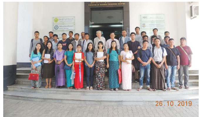
အောက်တိုဘာလ(၂၆)ရက် နေ့က Fed.MES Conference Room တွင် Opening Ceremony of AWF Pre-Training ပြုလုပ်ခဲ့ပြီး စုပေါင်း ဓာတ်ပုံရိုက်ကြစဉ်။