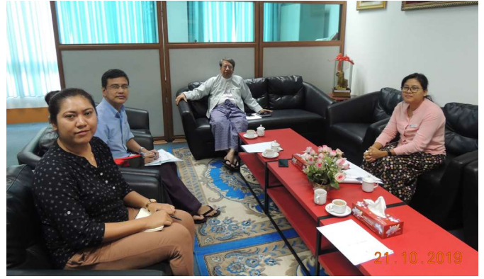
အောက်တိုဘာလ(၂၁)ရက် နေ့က Fed. MES တွင် ပြုလုပ်သော Fed. MES, Suu Foundation နှင့် Total E&P Myanmar တို့၏ Steering Committee Meeting ပြုလုပ်ခဲ့စဉ်။