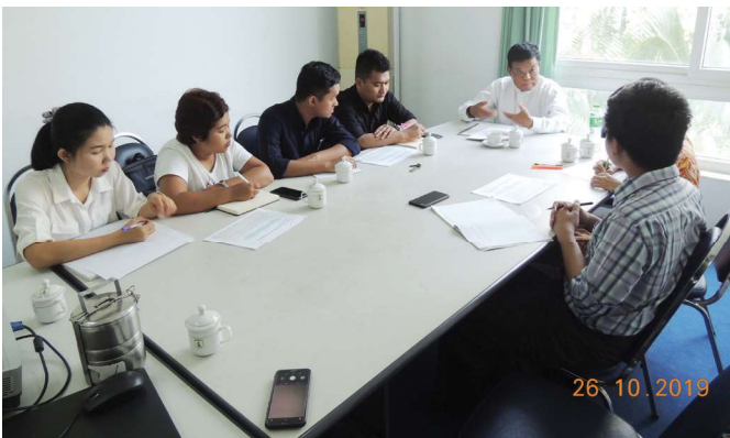
အောက်တိုဘာလ(၂၆)ရက် နေ့က Fed.MES Meeting Room-2 တွင် ‘Inhouse Training of Special Project Cmt.’ ပြုလုပ်ခဲ့စဉ်။