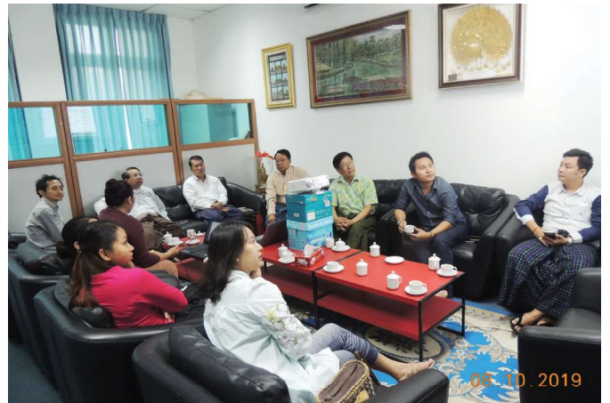
အောက်တိုဘာလ(၇)ရက် နေ့က Fed.MES President Office Room တွင် ‘Meeting between Fed. MES and Hi-Tech Pacific Pte.,Ltd.’ ပြုလုပ်ခဲ့စဉ်။