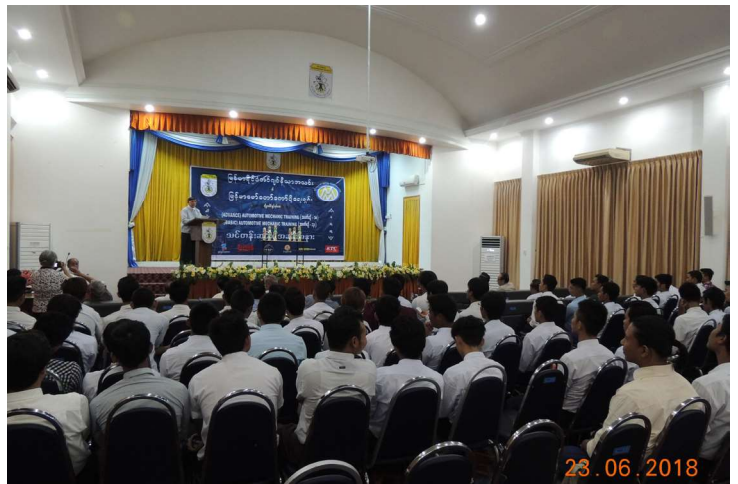
ဇွန်လ(၂၃)ရက်နေ့က MES Function Hall တွင် အဆင့်မြင့် မော်တော်ယာဉ် စက်ပြင်သင်တန်းအမှတ်စဉ် (၁၈) နှင့် အခြေခံမော်တော်ယာဉ်စက်ပြင်သင်တန်းအမှတ်စဉ်(၁၃) တို့၏ ပိတ်ပွဲအခမ်းအနားများ ကျင်းပနေစဉ်။