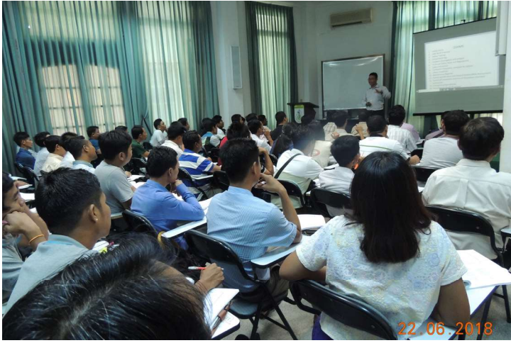
ဇွန်လ(၂၁)ရက်နေ့မှ (၂၄)ရက်နေ့အထိ MES Seminar Room တွင် MES နှင့် Global Enchanting Safety and Management Training Centre တို့မှ ပူးပေါင်းစီစဉ်သော “Certified Safety Supervisor” ခေါင်းစဉ်ဖြင့် သင်တန်း ဖွင့်လှစ် သင်ကြားပေးနေစဉ်။