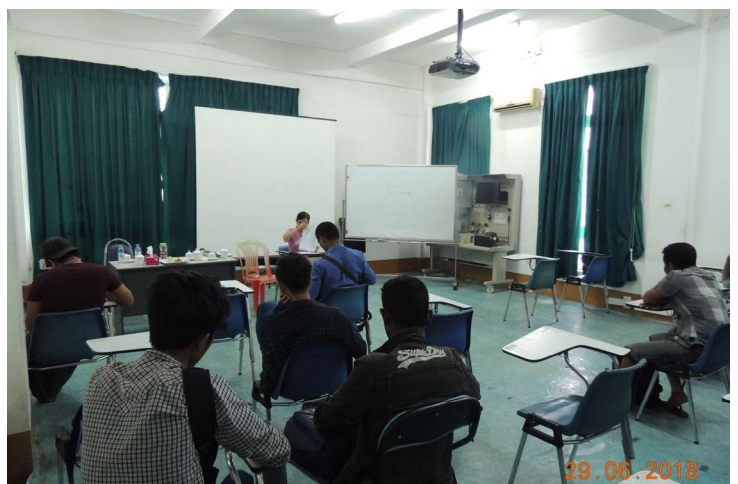
ဇွန်လ(၂၉)ရက်နေ့က MES Training Room တွင် JFE Trainees များအတွက် Psycho Test ပြုလုပ်နေစဉ်။