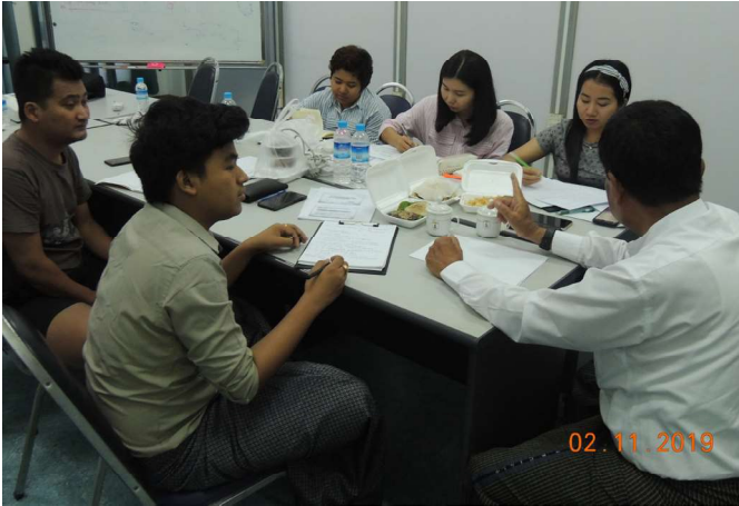
နိုဝင်ဘာလ ၂/၇ ရက်နေ့များက Fed.MES Meeting Room-3 တွင် Inhouse Training of Special Project Cmt. ပြုလုပ်ခဲ့စဉ်။