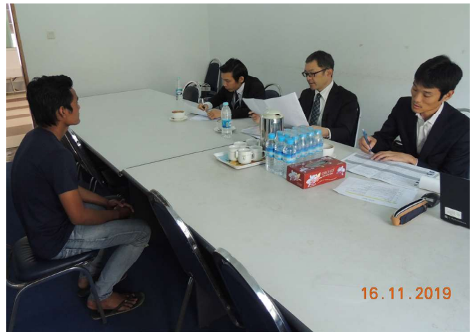
နိုဝင်ဘာလ(၁၆)ရက်နေ့က Fed.MES Meeting Room-2 တွင် 'JFE Interview' ပြုလုပ်ခဲ့စဉ်။