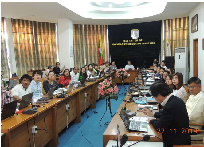
နိုဝင်ဘာလ ၂၇/၂၈/၂၉ ရက်နေ့များက Fed.MES Conference Room တွင် '8 th GIAS Training co-organized by Fed. MES and Nippon Koei. ပြုလုပ်ခဲ့စဉ်။