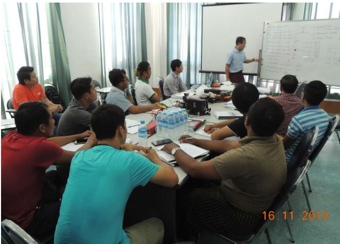
နိုဝင်ဘာလ ၃/၁၆/၁၇/၂၃/၂၄/၃၀ ရက်နေ့များက Fed.MES Meeting Room-3 တွင် 'Electrician Training' ပြုလုပ်ခဲ့စဉ်။