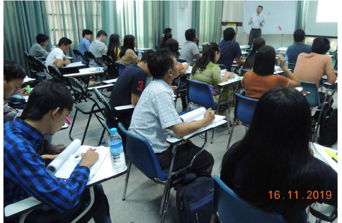
နိုဝင်ဘာလ ၂/၁၆ ရက်နေ့များက Fed.MES Seminar Roomတွင် 'AWE Training' ပြုလုပ်ခဲ့စဉ်။